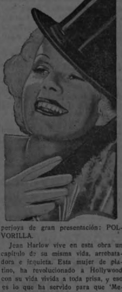
perjora de gran presentación: POLVORILLA.

perjora de gran presentación: "POLVORILLA".